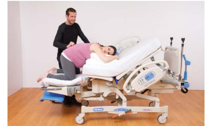
Auf allen Vieren