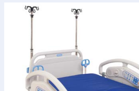
Ergonomisch geformte Schiebegriffe und fest angebrachte Infusionsständer.